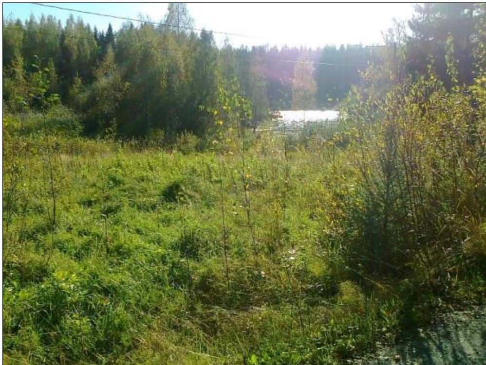
Kuva 4. Maisema yksityistieltä metsittyneen rantapellon yli rantaan (Karttulantie vastarannalla).