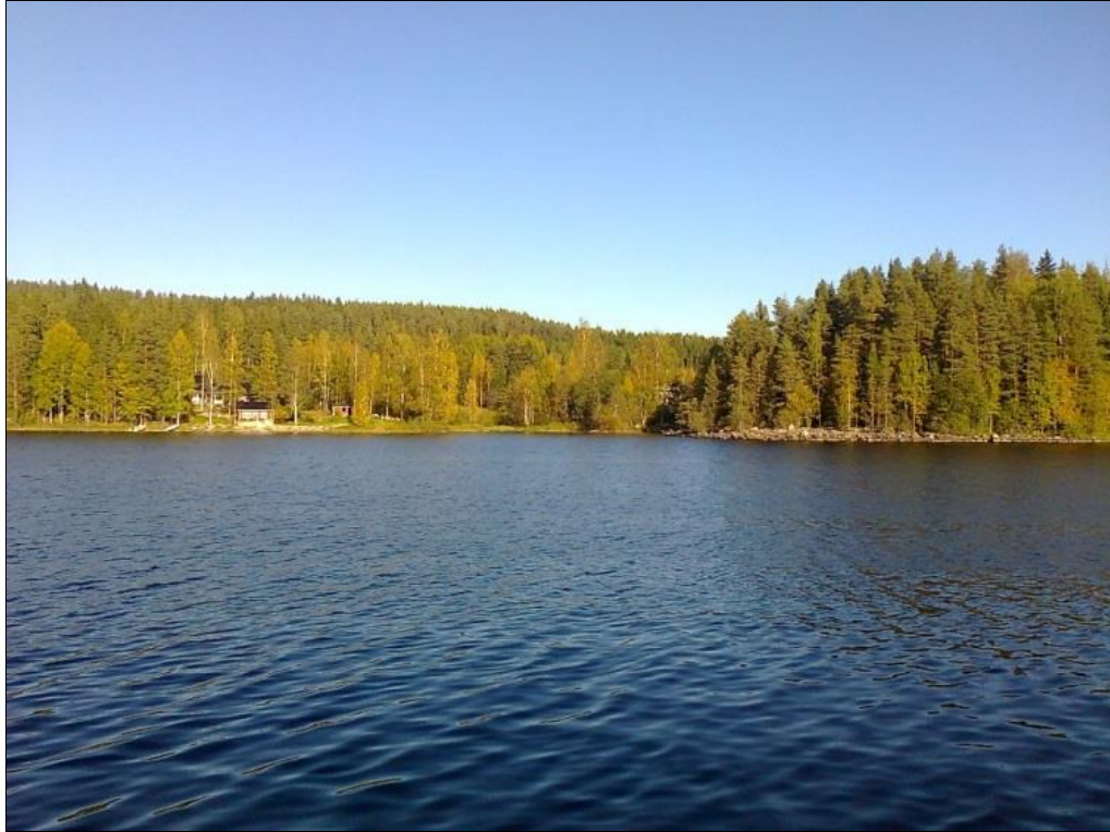
Kuva 1. Näkymä Karttulantieltä suunnittelualueelle.

ELY -keskuksen valitus tulee hylätä. Muilta osin kaupunki viittaa lausuntoon aiempien päätösten perusteluihin.