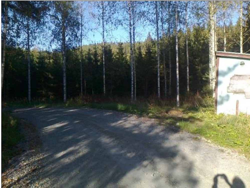
Kuva 3. Näkymä Haminamäen yksityistieltä suunnitellulle rakennuspaikalle.