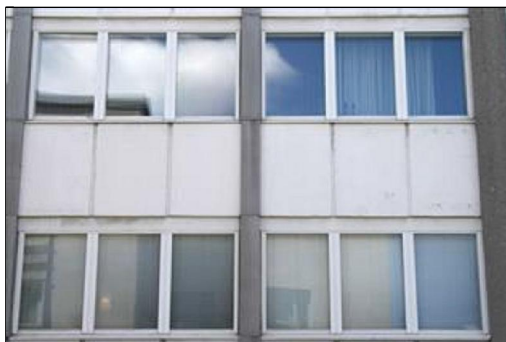
(Aada Mustonen 5.5.2015)