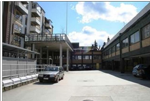
Näkymä sisäpihan puolelta. (Aada Mustonen 4.5.2015)