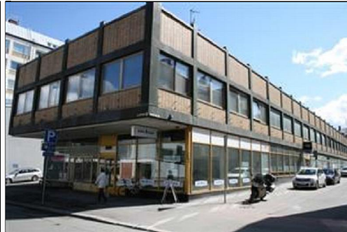
Näkymä Suokadulta kohti Myllykatua. Pohjoispääty ja länsisivu. (Aada Mustonen 4.5.2015)