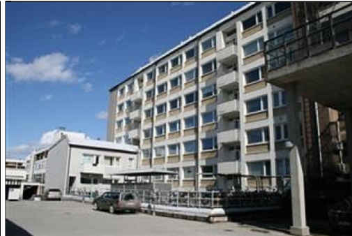
Puijonkatu 24:n itäinen pääjulkisivu ja pohjospääty Suokadun ja Puijonkadun risteystä kuvattuna. (Aada Mustonen 4.5.2015) Läntinen takajulkisivu. (Aada Mustonen 4.5.2015)