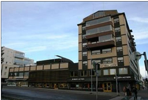
Eteläsivu Puijonkadun ja Majalahdenkadun risteyksestä kuvattuna. (Aada Mustonen 4.5.2015)