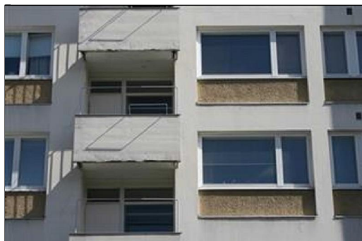
(Aada Mustonen 5.5.2015)