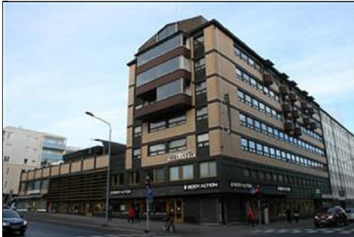
Eteläsivu Maljalahdenkadun puolella ja itäsivu Puijonkadun puolella.