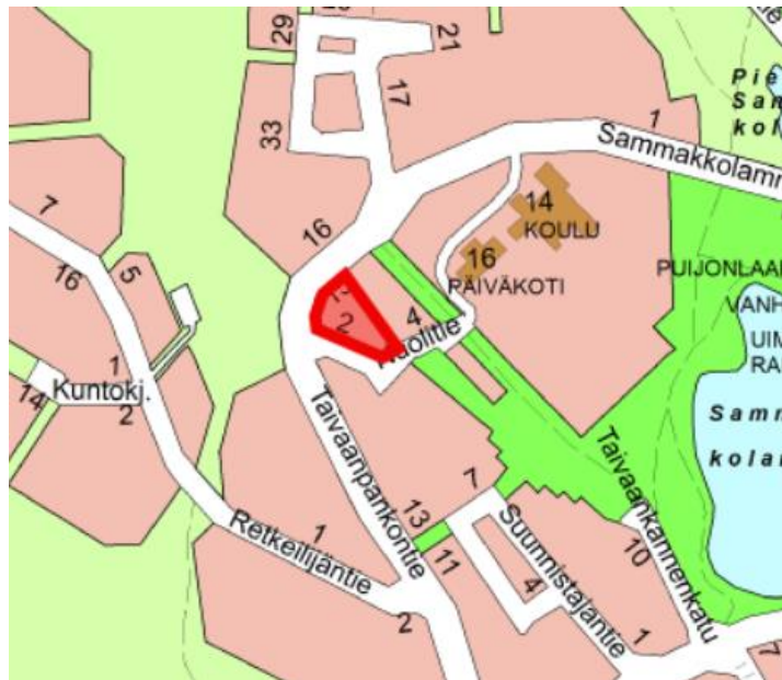
kuva 1: opaskartta

Tontin sijainti on esitetty oheisissa kartoissa.