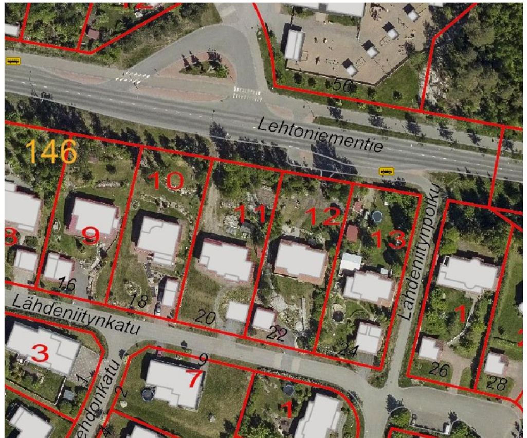
Kuva 1. Tonteilla 146-11, -12 ja -13 on ajoneuvoliittymät sekä Lehtoniementielle että Lähdeniitynkadulle.