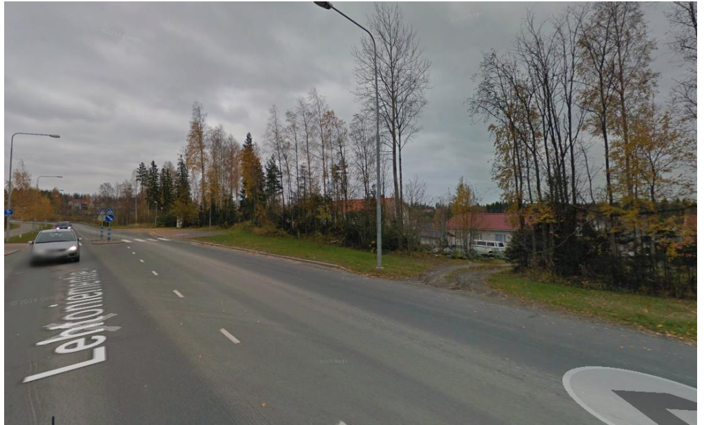
Kuva 3. Tontin 146-11 ajoneuvoliittymä Lehtoniementielle.