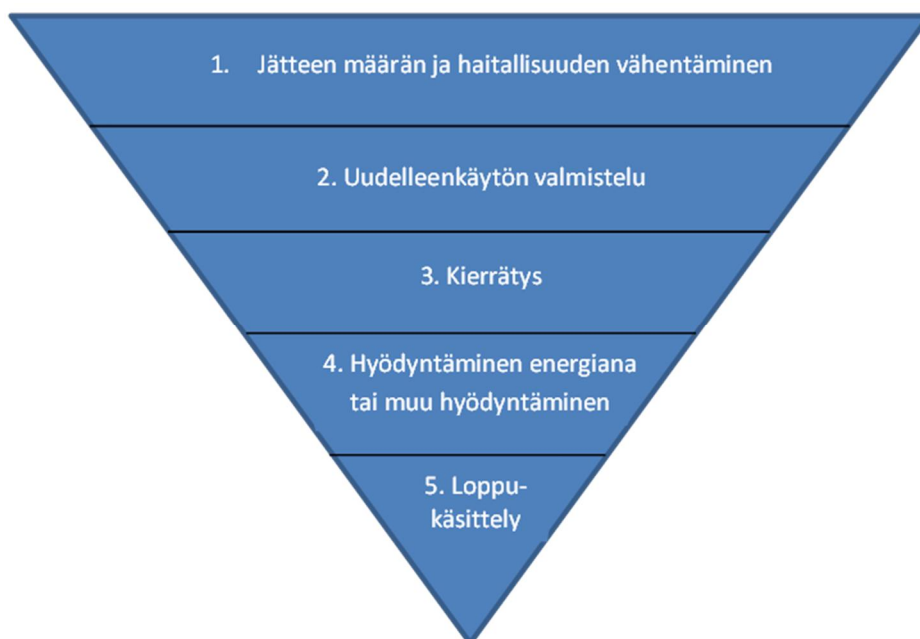
Kuva 1. Jätehuollon etusijajärjestys

Jätelain mukaan ympäristöministeriön on jätelain tarkoituksen toteuttamisen ja säännösten täytäntöönpanon edistämiseksi valmistettava valtioneuvoston hyväksyttäväksi valtakunnallinen jätesuunnitelma. Tämä suunnitelma on ollut päivitettävänä samaan aikaan kuin kuntien jätepoliittista ohjelmaa on laadittu. Ohjelman päivitystyössä on saatu viitteitä suunnitelmassa esiin nostettavista asioista, joita on huomioitu myös tässä ohjelmassa, jotta tavoitteet olisivat samansuuntaisia.