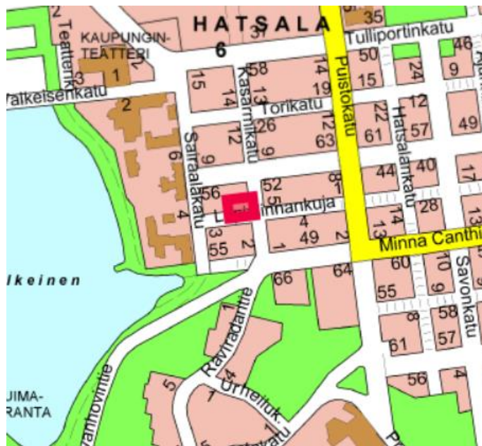
Kuva 1: sijainti

Tontin sijainti on esitetty oheisissa kartoissa.