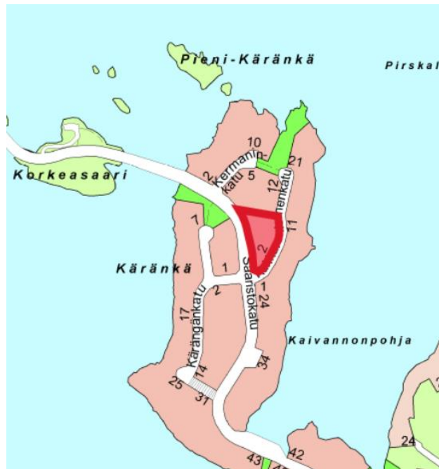
kuva 1: sijainti

Tontin sijainti on esitetty oheisissa kartoissa.