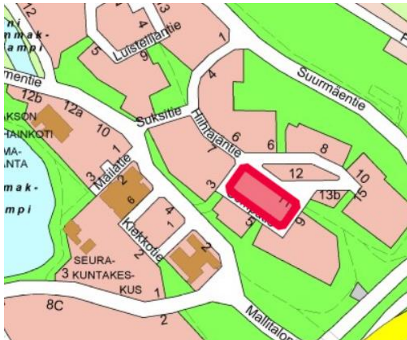
kuva 1: kaava-alueen sijainti

Kaavan muutosalue ja tontti 12-16-1 on esitetty oheisissa kartoissa.