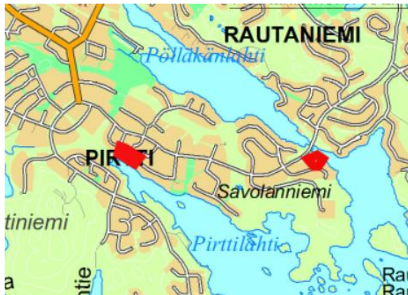
Yleiskartta tonttien sijainnista

Tonttien sijainti on esitetty oheisissa kartoissa.