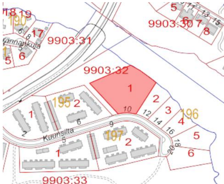
Savolanniemen itäosan tontti