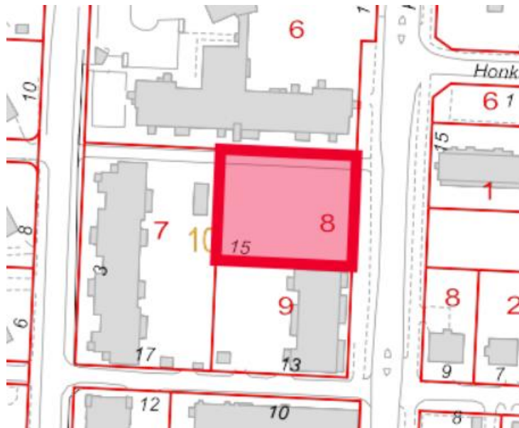
Kuva 3: tontti 297-10-10-8

Kuopion Vanhustenkotiyhdistys ry on vuonna 1969 perustettu yleishyödyllinen yhdistys, jonka tarkoituksena on toimia vanhusten sosiaalisen aseman ja asunto-olojen parantamiseksi sekä heidän fyysisen ja psyykkisen hyvinvointinsa edistämiseksi.