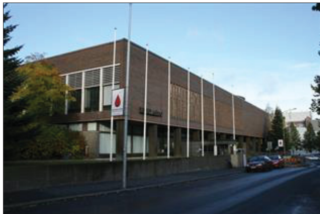
Kirjastorakennuksen eteläpäätyä ja itäsiivu Maaherrankadulta kuvattuna.