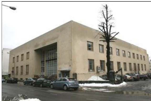
Postitalo Kuninkaankadun varrella.