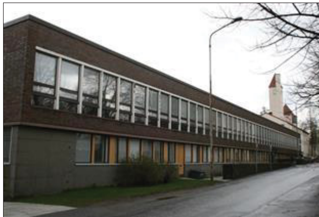
Kirjastorakennus Museokadulta kuvattuna.