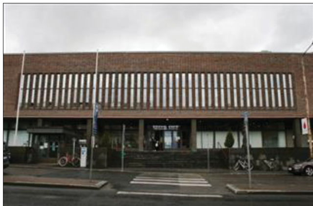
Kirjaston itäistä pääjulkisivua Maaherrankadun puolella.