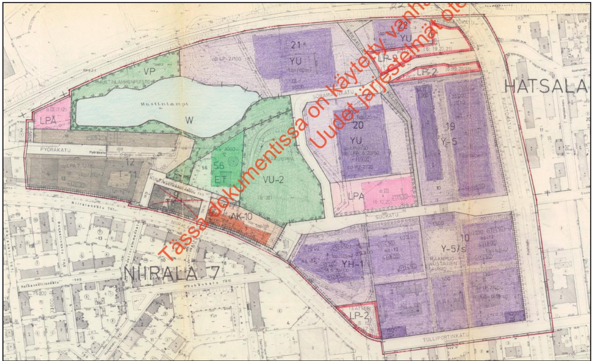
Liite 2 Voimassa oleva keskeisen kaupunkialueen yleiskaava, vahvistettu 9.10.2008