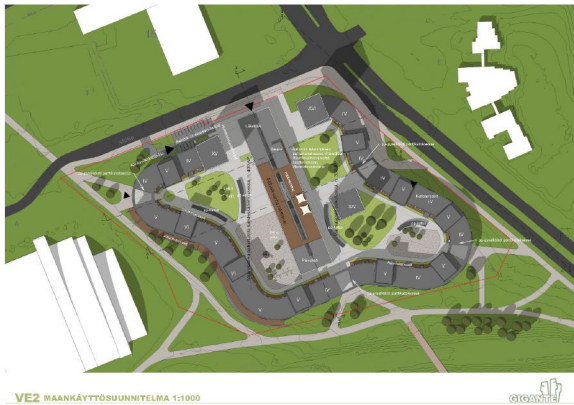
Savonian Opistotien kampus VE2A