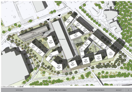
Savonian Opistotien kampus VE1A

Valmisteluaineistoon sisältyneet vaihtoehdot, joista lausunnot on annettu: