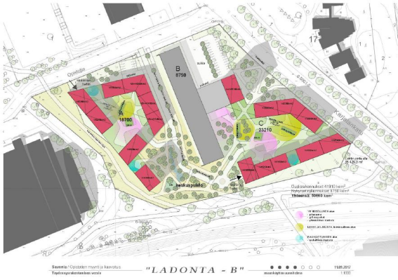
Savonian Opistotien kampus VE3A