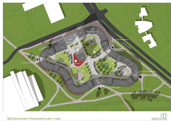
Savonian Opistotien kampus VE2B