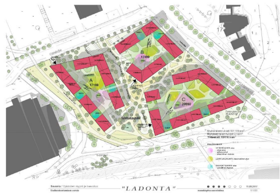
Savonian Opistotien kampus VE3B