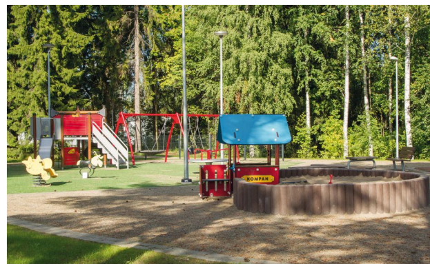
Huuhan- ja Otsonpuisto 2017