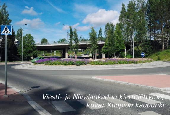
Viesti- ja Niiralankadun kiertoliittymä