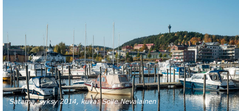
Satama, syksy 2014