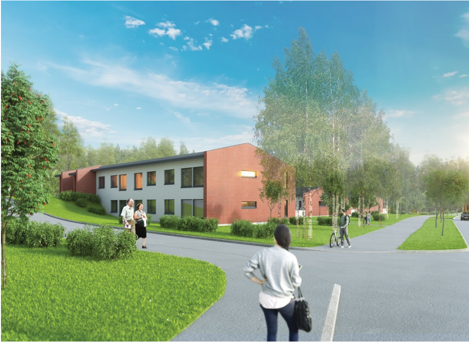
Kuva 4 Havainnekuva korttelista 33