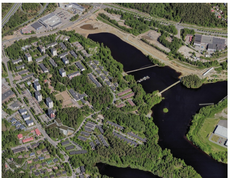
Kuva 2 Havainnekuva koko suunnittelualueesta

Suojellut puut tulee suojata rakentamisen aikana.