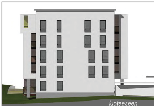
Kuva 5 Aluejulkisivu korttelista 33 Särkiniementien suuntaan