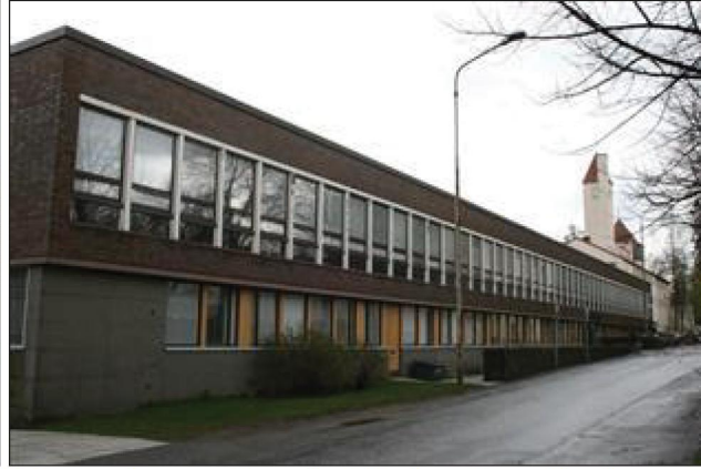
Kirjastorakennus Museokadulta kuvattuna.