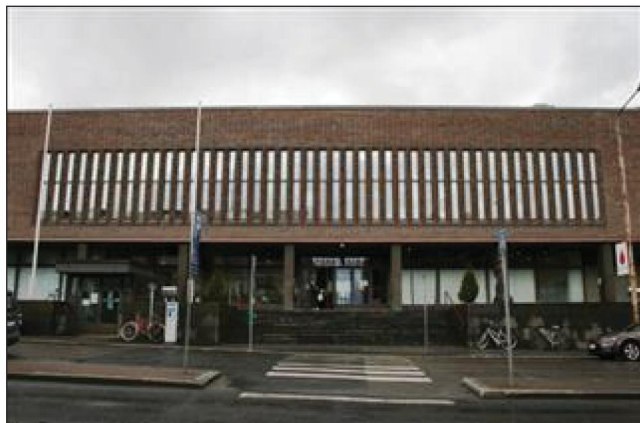
Kirjaston itäistä pääjulkisivua Maaherrankadun puolella.