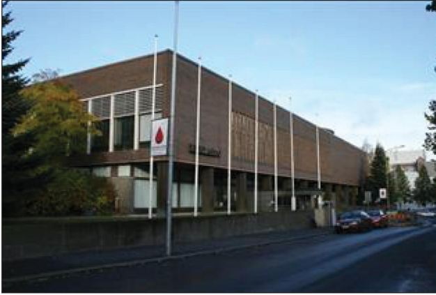
Kirjastorakennuksen eteläpäätyä ja itäsiivu Maaherrankadulta kuvattuna.