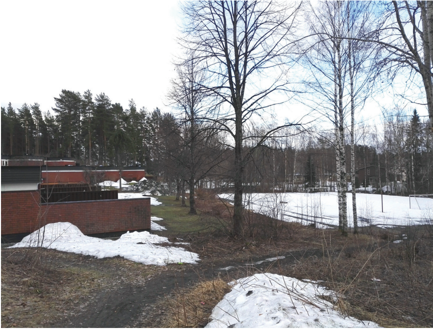
kuva rivitalojen ja pallokentän välisestä puustosta

uuden asumisen välissä säilyttää myös kaupunkikuvallisista syistä, joka on myös asukkaiden tavoite.