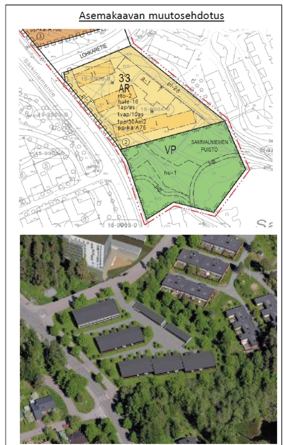
kuva nykytilanteesta ja asemakaavaehdotuksen esittämästä rakentamisesta