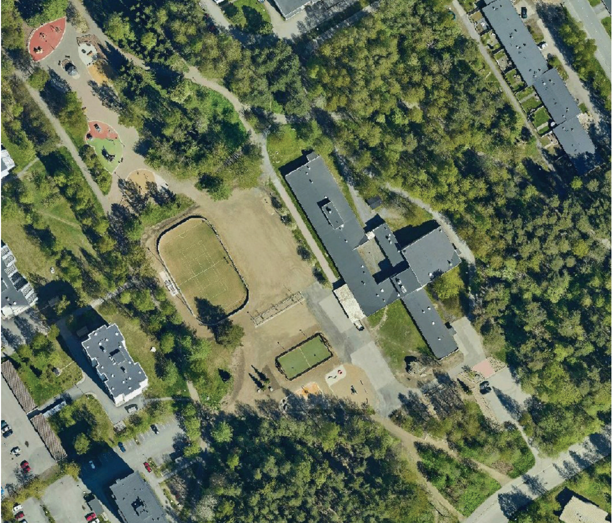
kuva Särkiniemen lähiliikunta-alueesta

remmin sopivaksi yhteistyössä asukasyhdistyksen kanssa. Kaupunki on jo ilmoittanut muuttavansa Rauhalahden nurmikentän tekonurmikentäksi, joka parantaa mm. kaupungiosan junioreiden harjoitusmahdollisuuksia.