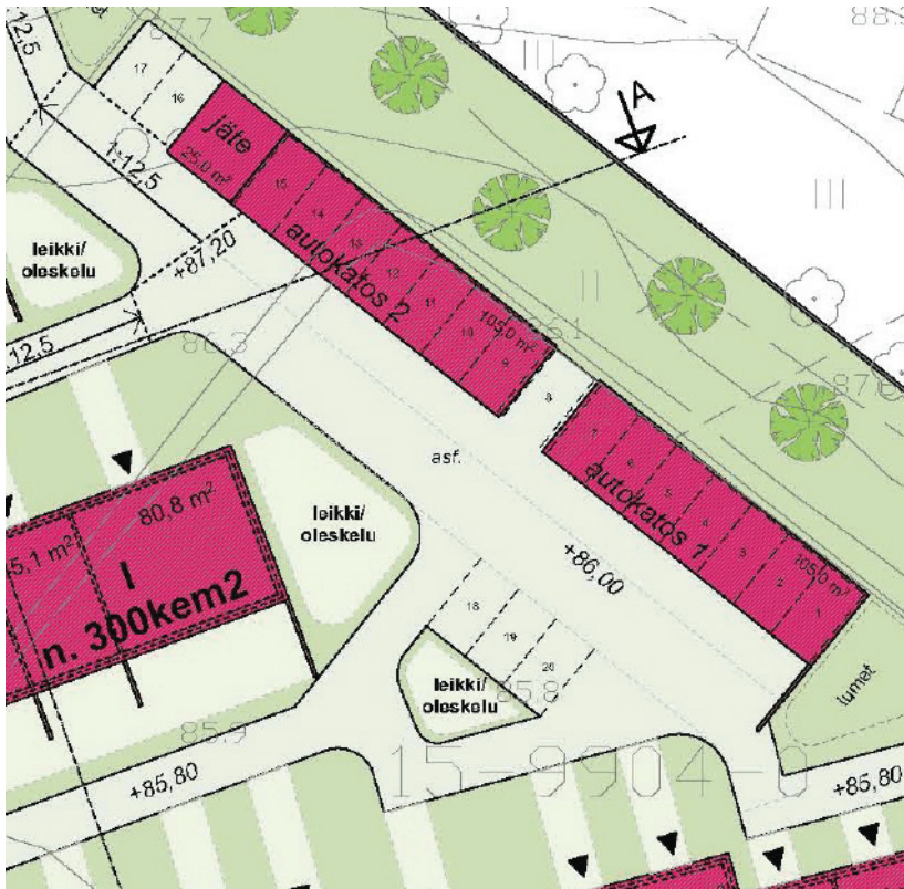
kuva autopaikkojen sijoittamisesta

Tontinkäyttösuunnitelmassa on osoitettu kaikki 20 autopaikkaa numeroituna. 14 autopaikkaa on osoitettu sijoitettavaksi autokatoisiin ja kuusi paikoista on merkitty avopaikoiksi.