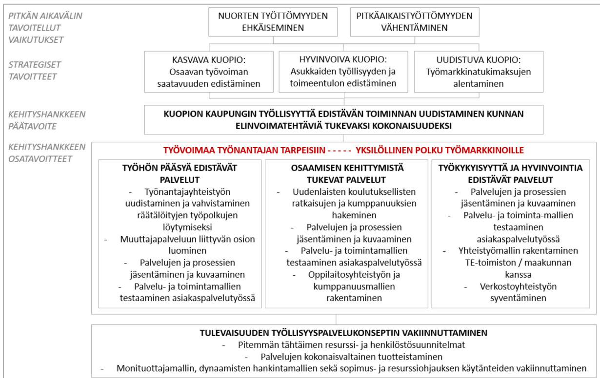
Kuva 1. Kehityshankkeen tavoitepuu

Kehityshankkeen päätavoitteena on kaupungin työllisyyttä edistävän toiminnan uudistaminen elinvoimatehtäviä tukevaksi kokonaisuudeksi. Toiminnan tasolla hankkeen osatavoitteet muodostuvat asiakaslähtöisten, joustavien, kustannustehokkaiden ja vaikuttavien palvelukokonaisuuksien ja yksittäisten palvelujen jäsentämisestä, mallintamisesta ja tuotteistamisesta. Kehityshankkeen tavoitteiden asettelu on kokonaisuudessaan esitetty kuvassa 1. Kehityshankkeen tavoitepuu.