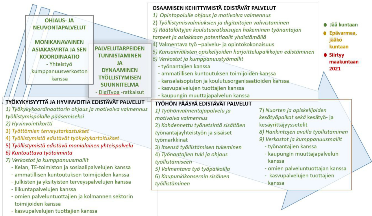
Kuva 2. Tulevaisuuden palvelukokonaisuuden hahmotelmaa.

Suunnitteilla oleva hanke on ennen kaikkea tuotekehityshanke, jonka kehitystyön keskiössä on asiakastyö ja sen kautta tehtävä LEAN-kehittäminen sekä palvelu- ja toimintamallikokeilut. Asiakaspalvelutyötä kehitetään edelleen työllisyyskokeilussa rakennettujen hyvien käytänteiden pohjalta. Pääpaino on tulevaisuuden kunnan työllisyyspalvelujen luomisessa ja ylös ajamisessa teemalla osaamisperusteiset työllisyyspalvelut. Samalla pystytään toteuttamaan hallittu siirtyminen vanhoista palveluista (mm. TYP-palvelu ja kuntouttava työtoiminta) uusiin palveluihin ja toimintamalleihin. Uutta palvelukokonaisuutta sekä siitä maakuntaudistuksen yhteydessä pois lähteviä osia on kuvattu alla kuvassa 2. Tulevaisuuden palvelukokonaisuuden hahmotelmaa.