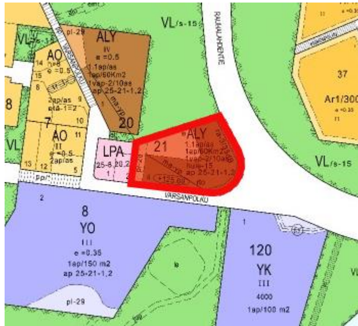
kuva 2: tontti 297-25-21-4

Tontti 297-25-21-4 on asemakaavassa osoitettu Asuin-, liike- ja toimistorakennusten sekä yleisten rakennusten korttelialueeksi ALY.