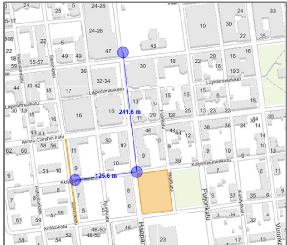
Kuva 2. Savonkadun pysäköintipaikkojen etäisyys torilta.

Myös Savonkadun länsireunalla on nykyisin pysäköinti sallittu Koljonniemenkadun ja Kirkkokadun välisellä osuudella, jossa on tilaa seitsemälle henkilöautolle. Torikauppiaiden kuorma-autojen pysäköinnin vuoksi pysäköinti Savonkadun länsireunalla kielletään koko katuosuudelta.