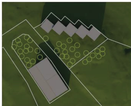
20.3. ja 23.9. klo 14.00