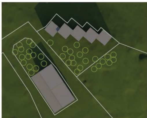
20.3. ja 23.9. klo 12.00