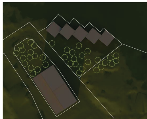
22.12. klo 14.00