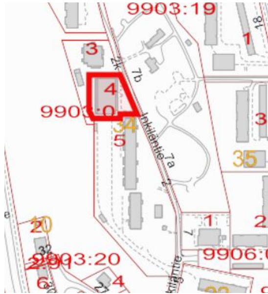
kuva 2: virastokartta

Tontti on asemakaavassa osoitettu asuin-, liike-, toimisto- ja palveluasumisrakennusten korttelialueeksi (ALP-1). Tontin pinta-ala on 1 913 m 2 ja rakennusoikeus 3 500 k-m 2 .