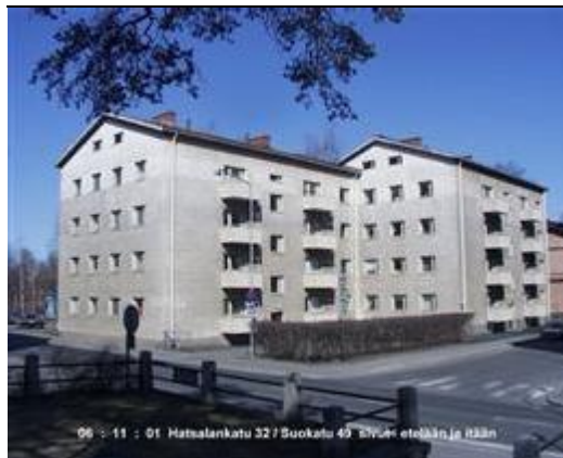
As Oy Hatsalankruunu Sankaripuistosta kuvattuna vuonna 1999. (Irja Huttunen)