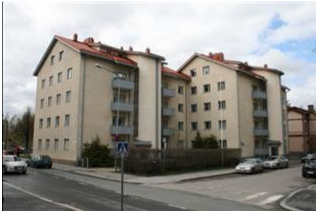
Rakennus Piispanpuistosta käsin kuvattuna. Suokadun puoleinen eteläpääty ja Hatsalankadun puoleinen itäsiivu.