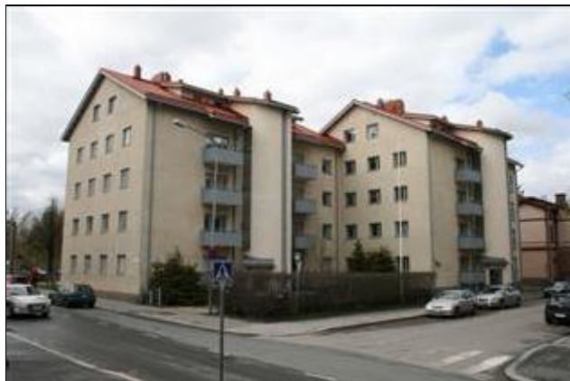
As Oy Hatsalankruunu Sankaripuistosta kuvattuna vuonna 2015.