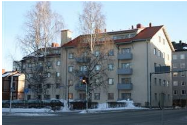
Puistokadun puoleinen länsisiivu ja Suokadun puoleinen eteläpääty Puistokadulta kuvattuna.