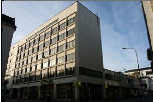
Kohde koilliskulmalta Vuorikadun ja Tulliportinkadun kulmasta kuvattuna.