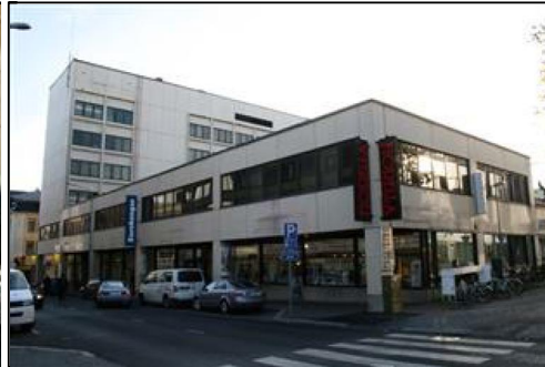
Kohde Tulliportinkadun ja Käsityökadun risteyksestä kuvattuna.