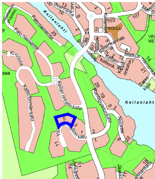
kuva 1: opaskartta

Tontin sijainti on esitetty oheisissa kartoissa.