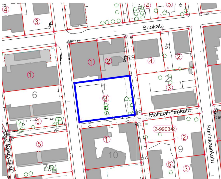
Tontin sijainti kantakartalla.