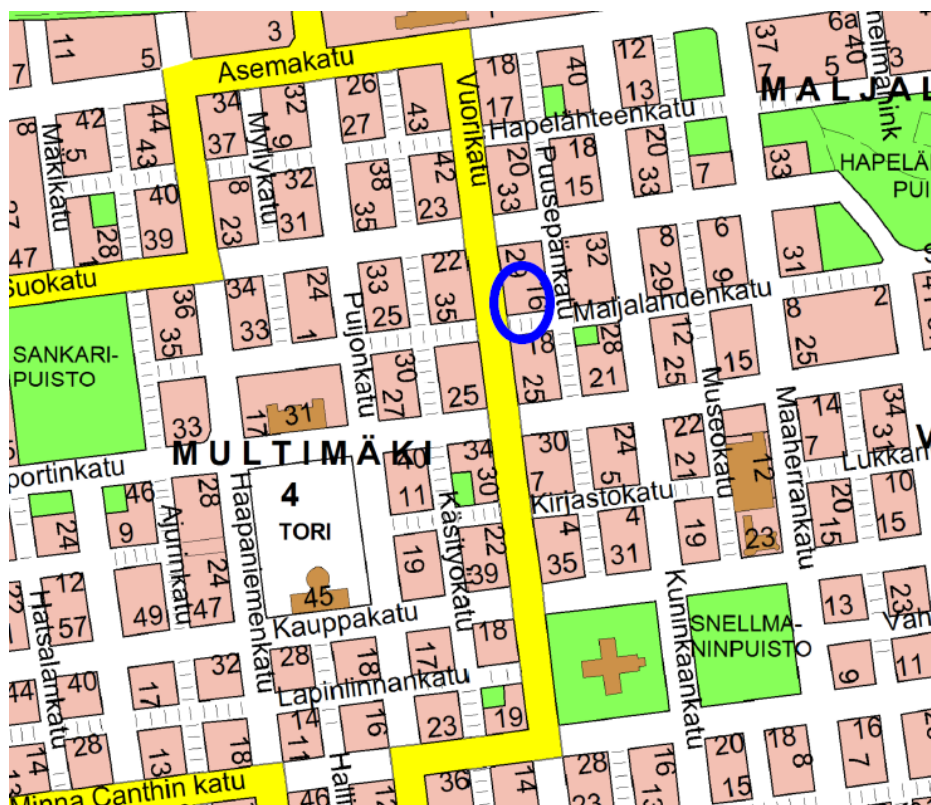
Tontin sijainti opaskartalla.