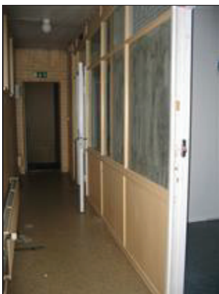
kuvateksti: Väliseinää. kuvalagi: tunnuskuva kuvausaika: 8.11.2005