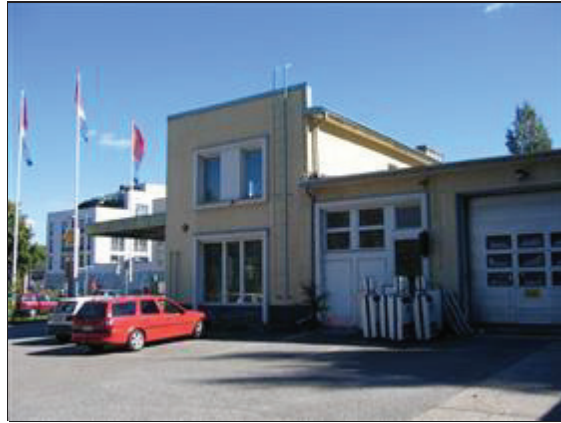
Pihalta.