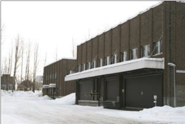
Itäsivu.