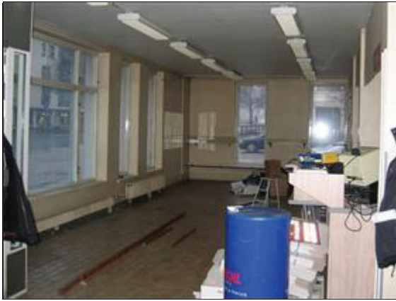
kuvateksti: Alakerta, kahvio. kuvalagi: tunnuskuva kuvausaika: 8.11.2005