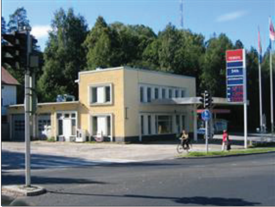
Kulma.