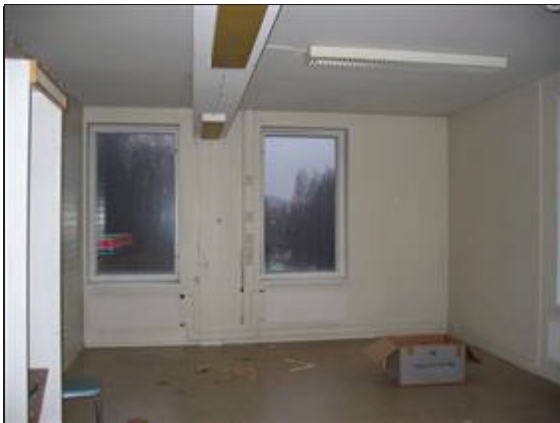
kuvateksti: Puijolle. kuvalagi: tunnuskuva kuvausaika: 8.11.2005