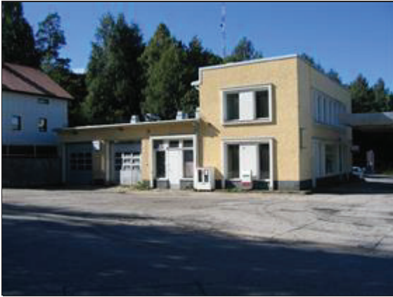
Rajakadulta.