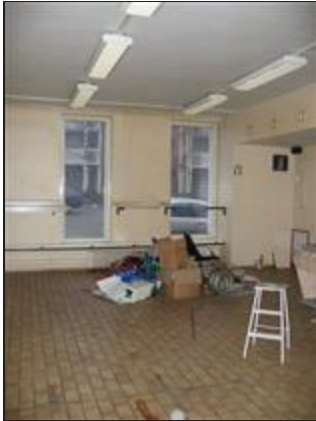
kuvateksti: Kahviosta Rajakadulle. kuvalagi: tunnuskuva kuvausaika: 8.11.2005