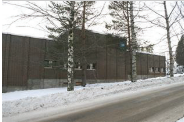
Pohjoissivu Kotkankallionkadun varrella.