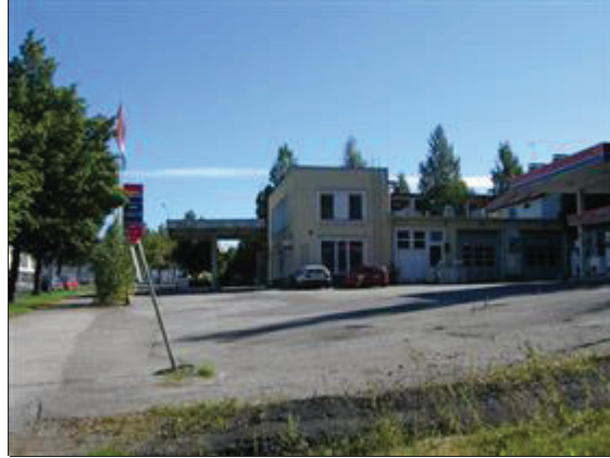
Pihamaa.