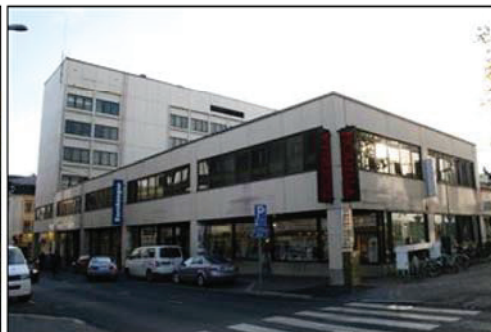
Kohde Tulliportinkadun ja Käsityökadun risteyksestä kuvattuna.