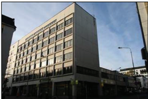
Kohde koilliskulmalta Vuorikadun ja Tulliportinkadun kulmasta kuvattuna.