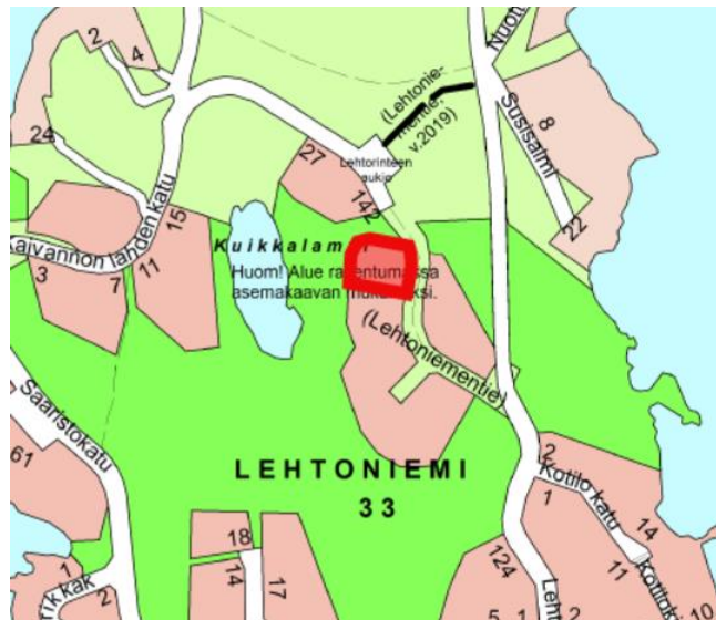
kuva 1: opaskartta (ks. asiakirja pdf-muodossa)

Tontin sijainti on esitetty oheisissa kartoissa (ks. asiakirja pdf-muodossa).