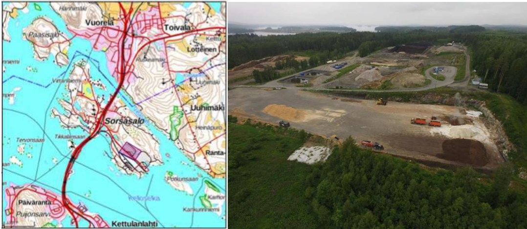
Hankealueen sijainti ja ilmakekuva nykytilanteesta