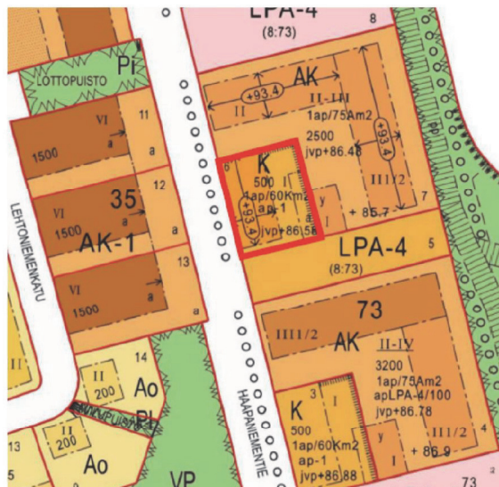
Kuva 4. Ote asemakaavasta, suunnittelualueen rajaus esitetty punaisella viivalla.