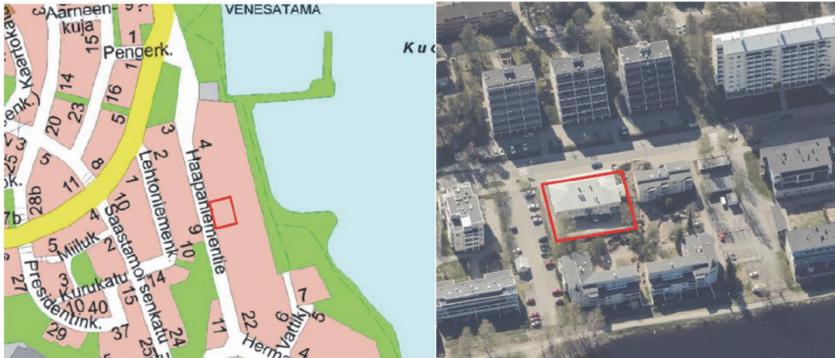
Kuva 1. Kaavamuutosalue, sijainnit merkitty punaisella viivalla