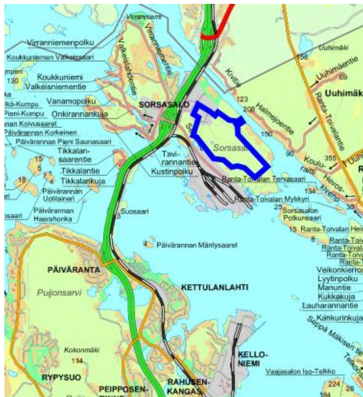
Tontin sijainti opaskartalla.

Finnulp Oy:n kanssa on neuvoteltu tehdastontista uusi esisopimusluonnos, jota esitetään kaupunkirakennelautakunnan ja edelleen kaupunginhallituksen hyväksyttäväksi. Esisopimusluonnos perustuu suurelta osin vuonna 2016 hyväksytyyn esisopimuksen mukaisiin ehtoihin. Kohteena on Sorsasalonsaaren kaupunginosassa sijaitseva tontti 297-22-21-12, jota koskeva biotuotetehtaan rakentamisen mahdollistava asemakaava on tullut voimaan 19.1.2018. Tontin pinta-ala on 893 372 m 2 . Tontin sijainti on esitetty oheisissa kartoissa.