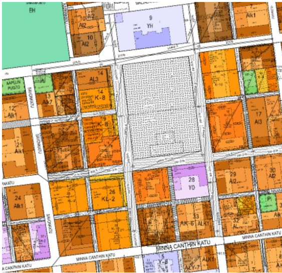
Kuva 5. Ote ajantasa-asemakaavasta

Voimassa oleviin kaavoihin voi tutustua kaupungin karttapalvelussa: http://karttapalvelu.kuopio.fi