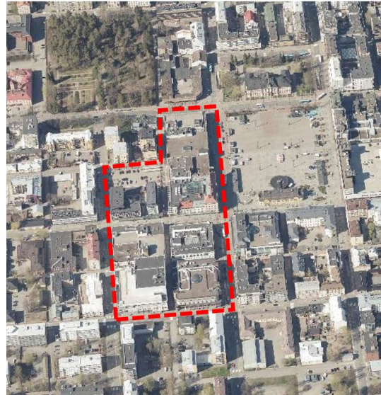
Kuva 2. Viistoilmakuva etelästä, likimääräinen kaavamuutosalue on merkitty punaisella viivalla

Mikä osallistumis- ja arviointisuunnitelma (OAS) on?