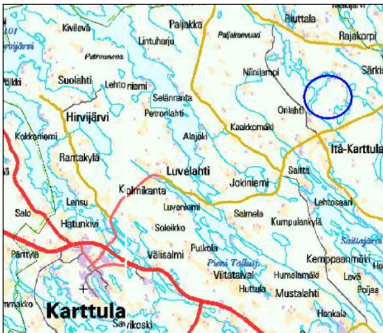
Kuva 1: Suunnittelualueen sijainti

Ranta-asemakaavan muutos koskee osaa Martinlahti 297-481-1-108 tilaa Murtosen ja Salmisen järvien rannoilla Lyytikälän kylässä Itä-Karttulassa.