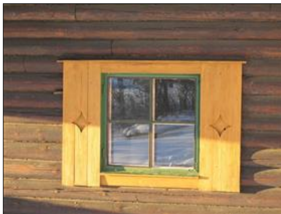
Saunan ikkuna.

id: 300199 rakennustunnus: 1028843522 rakennustyyppi: saunat