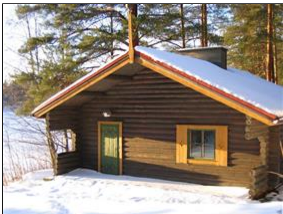
Rantasauna.