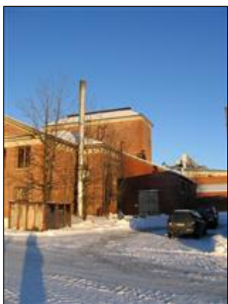
Kattilahuonee sahalta.