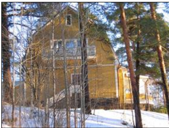
Toinen pääty.