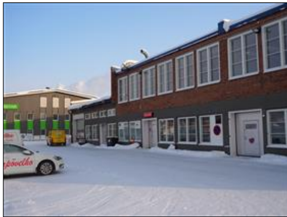
Naulaamorakennus takavasemmalla helmikuussa 2021.