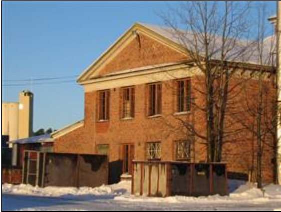
Kattilahuoneen päätyä.