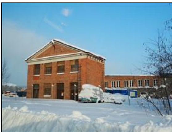
Rakennus vuonna 2021. Takaosa purettu.