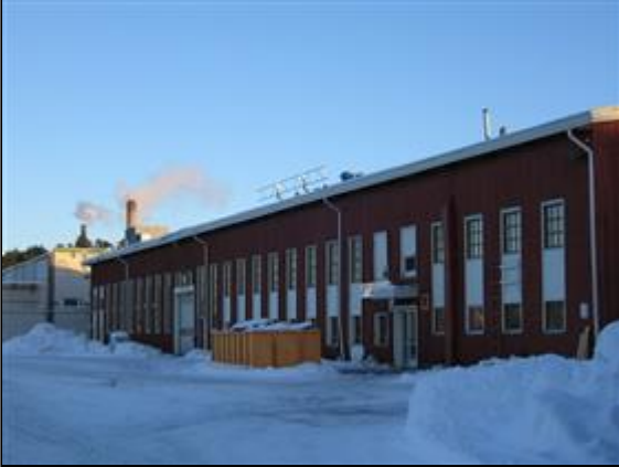
Naulaamo.