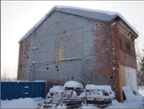
kuvateksti: kuvalaji: tunnuskuva kuvausaika: 04.02.2021