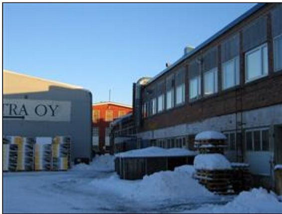
Naulaamoon päin.