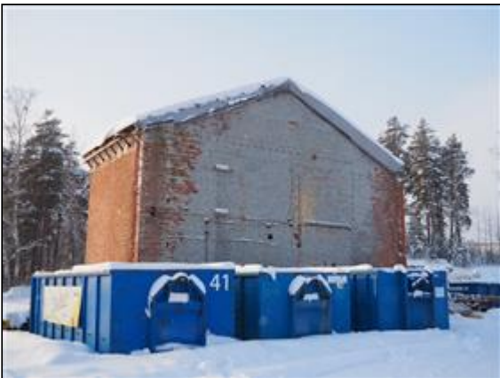
kuvateksti: kuvalaji: tunnuskuva kuvausaika: 04.02.2021