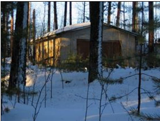
Autotalli.