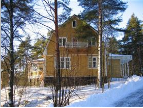
Huvilan pääty.