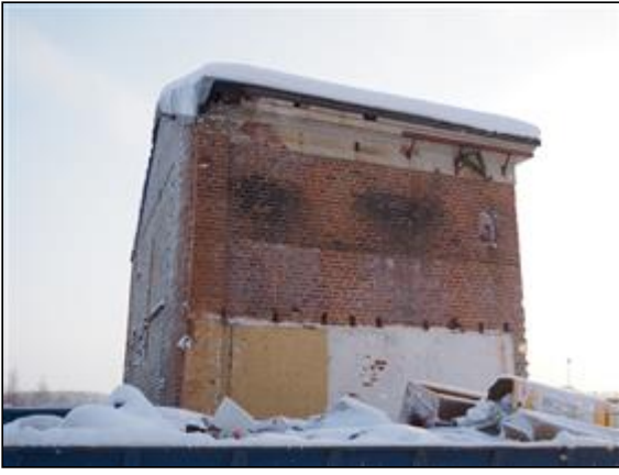
kuvateksti: kuvalaji: tunnuskuva kuvausaika: 04.02.2021