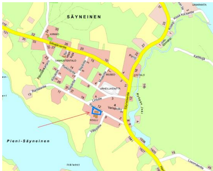
Sijainti (ks. asiakirja pdf-muodossa)

Vuokra-alueen sijainti ja rajaus on esitetty oheisissa kartoissa.