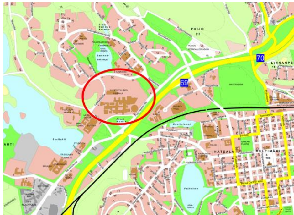
Kiinteistön sijainti opaskartalla.

Pohjois-Savon Sairaanhoitopiirin kuntayhtymä omistaa kiinteistön 297-12-2-7, jolla sijaitsee KYS Puijon sairaala. Kiinteistön sijainti on osoitettu oheisissa kartoissa.