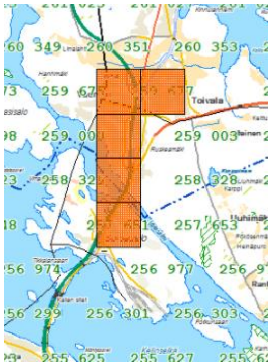
Kuva 1: Vuorelan, Toivalan ja Sorsasalon alueen ongelmavuodot sijainti kartalla.

Aluehallintovirasto on pyytänyt Pohjois-Savon alueen pelastustoimelta selvitystä palvelutasossa olevista epäkohdista 28.11.2017 (ISAVI/3344/2017). Selvityspyynnössä osoitettiin epäkohtia muun muassa Vuorelan ja Toivalan alueella olevissa riskiruudussa (kuvassa 1 on esitetty alueen ongelmavuodot). Alueen pelastustoimen 28.2.2018 antamassa selvityksessä (asianro 9314/2017) ei kiistetty havaittuja epäkohtia, ja lueteltiin toimenpiteitä tilanteen korjaamiseksi. Selvityksen mukaan toimitilojen rakentaminen suunnitellaan Kuopion kaupungin päätöksellä selvityksen antamisajan mukaiselle suunnittelukaudelle. Muiden selvityksessä annettujen korjaavien toimenpiteiden vaikutukset palvelutasoon ovat alkaneet vuosina 2017 ja 2018, lukuun ottamatta paloaseman rakentamisesta aiheutuvaa palvelutason paranemista.