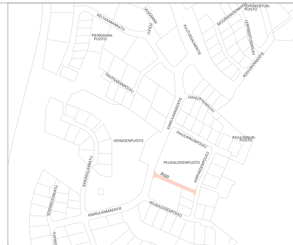
Suunnitelma-aineisto © Kuopion kaupunki 2021