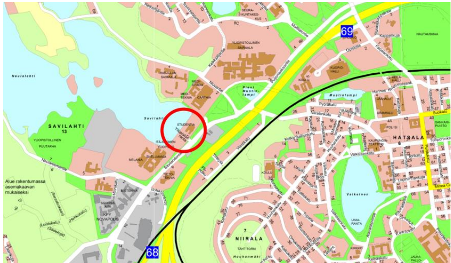
Sijainti esitettyä opaskartalla.

Kuopion Opiskelija-asunnot Oy on tehnyt vuokrasopimuksen Savilahden kaupunginosassa Itä-Suomen yliopiston kampusalueella sijaitsevasta kahdesta Suomen Yliopistokiinteistöt Oy:n omistamasta tontista. Studentian molemmin puolin olevien tonttien 297-13-2-20 ja 297-13-2-22 sijainnit on esitetty oheisissa kartoissa.