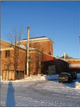
Kattilahuonee sahalta.