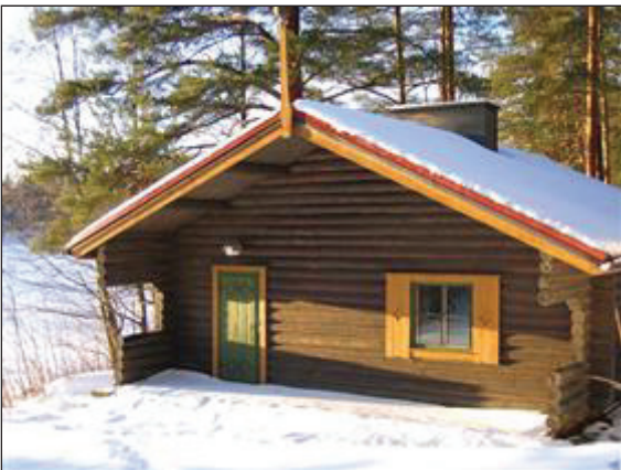
Rantasauna.