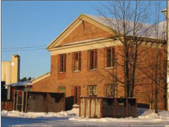
Kattilahuoneen päätyä.