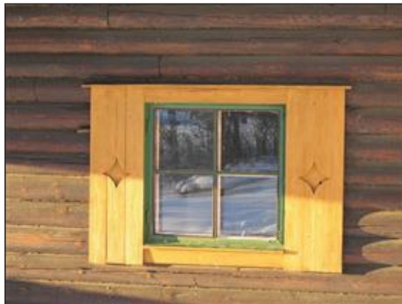
Saunan ikkuna.

id: 300199 rakennustunnus: 1028843522 rakennustyyppi: saunat