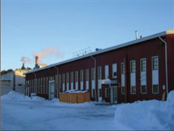
Naulaamo.