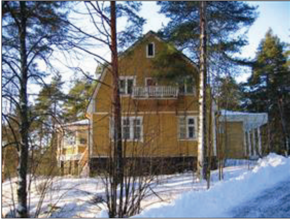
Huvilan pääty.