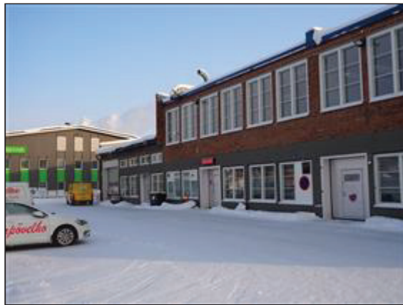
Naulaamorakennus takavasemmalla helmikuussa 2021.

id: 300202 rakennustyyppi: tehdasrakennukset alkup. käyttö: 699 muut teollisuuden tuotantorakennukset