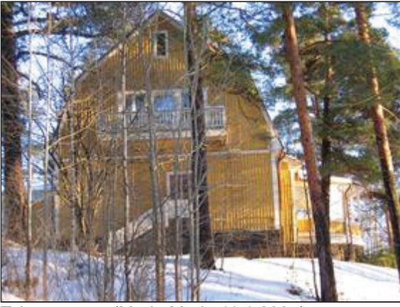
Toinen pääty.