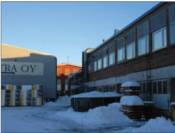
Naulaamoon päin.