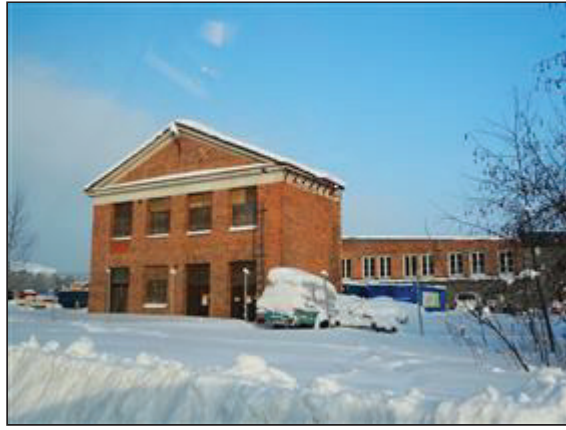
Rakennus vuonna 2021. Takaosa purettu.