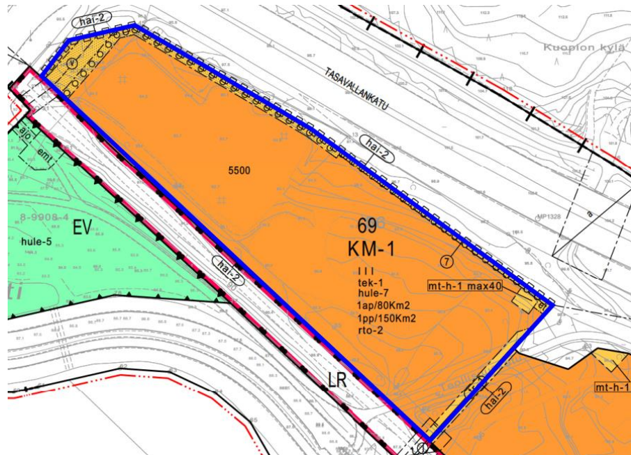
Tontin sijainti asemakaavakartassa.

Muodostettavan tontin 297-8-69-7 pinta-alaksi tulee 17 093 m 2 . Hyväksytyssä asemakaavassa tontti on osoitettu liikerakennusten korttelialueeksi, jolle saa sijoittaa paljon tilaa vaativan erikoistavaran ja sen toimialaan liittyvien oheistuotteiden vähittäiskaupan suurmyymälän (asemakaavamerkintä KM-1). Tontille on osoitettu rakennusoikeutta 5 500 k-m 2 .