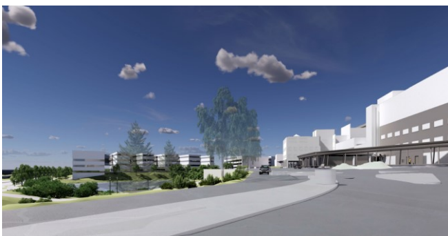
Kuva 4 Näkymä Eteläväylältä pääsisäänkäynnin A suuntaan, suuntaa antava kuva. Raami Arkkitehdit Oy, Arkkitehdit Kontukoski Oy.

Autot sijoitetaan pääosin pysäköintilaitoksiin. Tonttia varten vaadittavia autopaikkoja saa sijoittaa myös lähialueen LPY-korttelialueille tai muille pysäköintiin varattaville alueille.