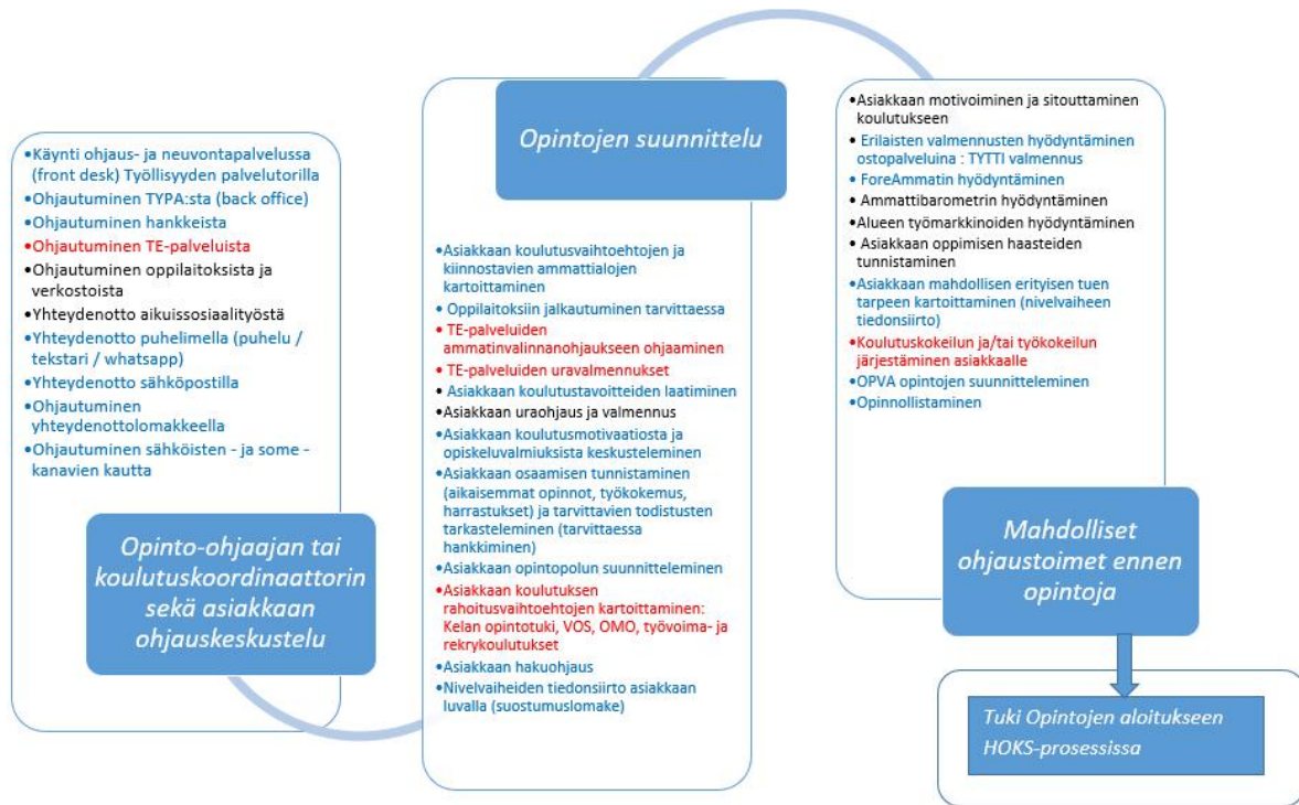
Kuvio 2. Asiakkaan ohjausprosessi koulutukseen ja opintoihin