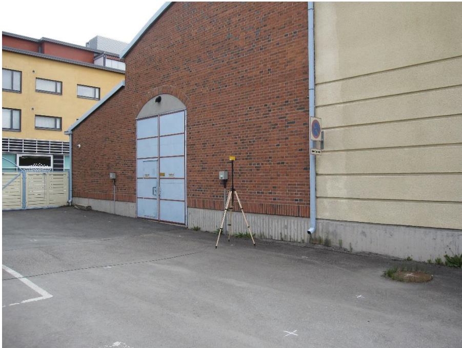
Kuva 4.9. Mittapiste B6, korkeus 2 metriä.