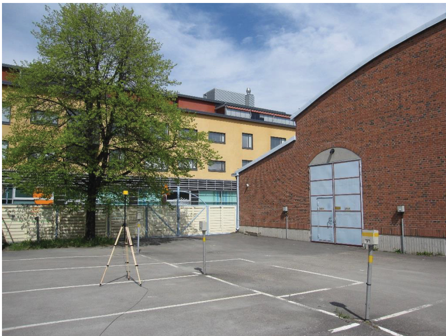
Kuva 4.12. Mittapiste F1, korkeus 2 metriä. Ympärillä autosähkötolppia, jotka vaikuttavat mittausepävarmuuteen.