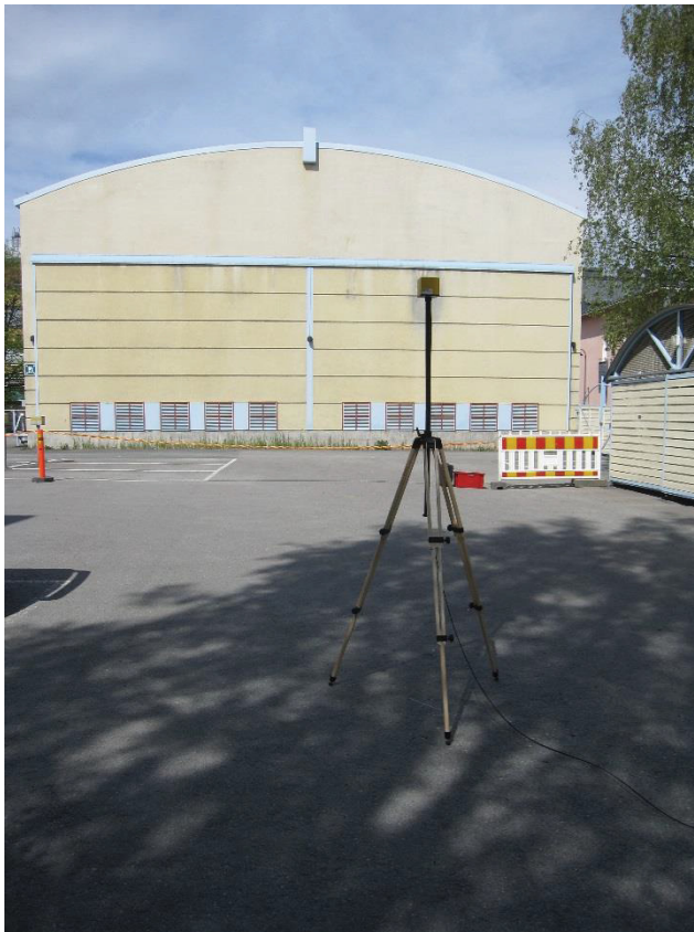
Kuva 4.15. Mittapiste E2, korkeus 2 metriä. Mittapisteen ympärillä oli runsaasti autoja parkissa, jotka eivät näy kuvassa. Mitatut tulokset mittapisteeltä ainoastaan suuntaa antavia.