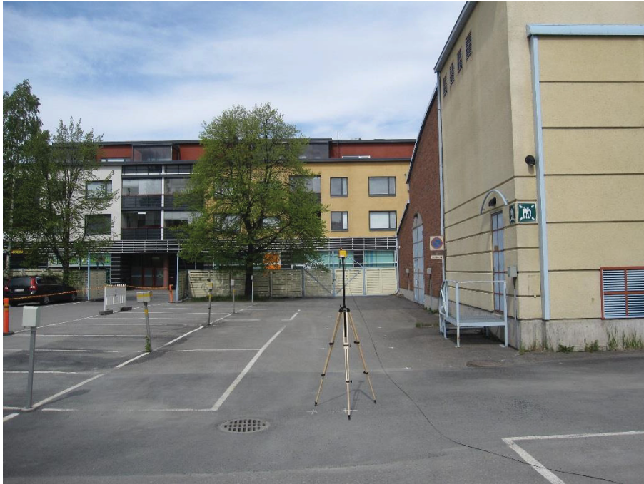
Kuva 4.11. Mittapiste A11, korkeus 2 metriä.