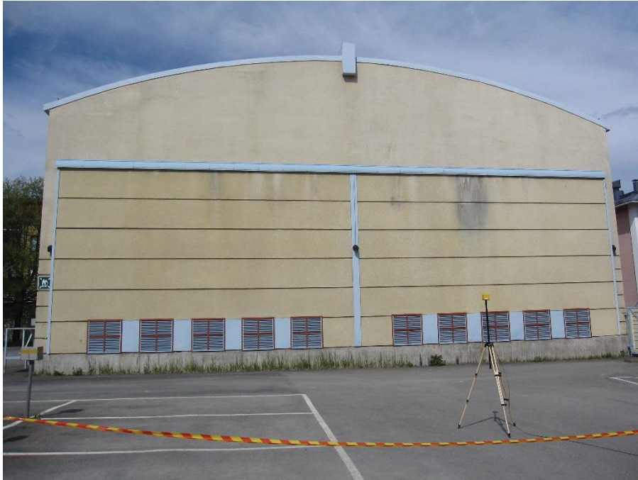
Kuva 4.14. Mittapiste E1, korkeus 2 metriä.