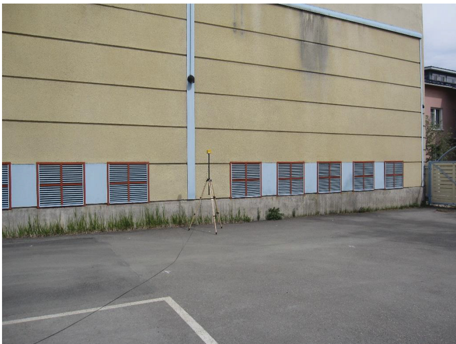
Kuva 4.10. Mittapiste A5, korkeus 2 metriä.