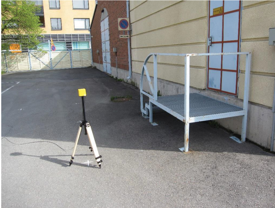
Kuva 4.7. Mittapiste B10, korkeus 1 metri.