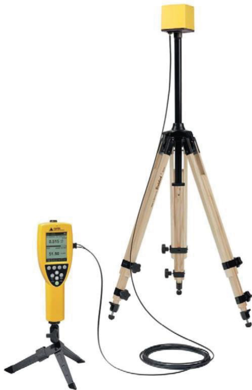
Kuva 4.1. Narda STS sähkö- ja magneettikenttien mittalaitteista taajuudelle 1 Hz – 400 kHz.