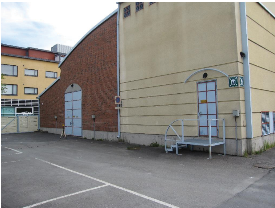
Kuva 4.8. Mittapiste B4, korkeus 1 metri. Länsiseinällä runsaasti mittausepävarmuuteen vaikuttavia, metallisia kiinteitä objekteja.