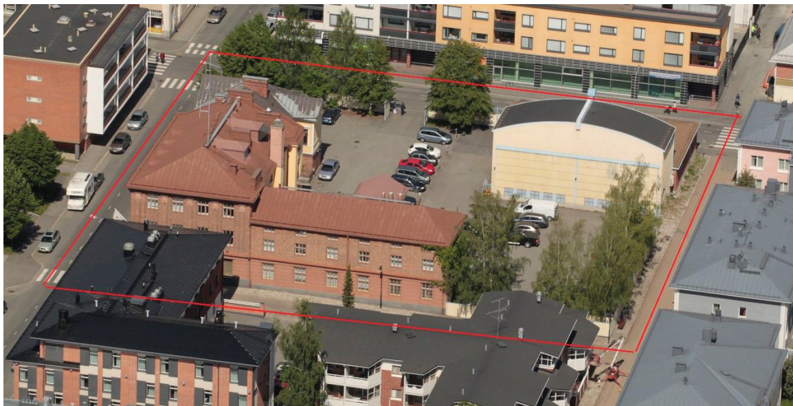
Kuva 2.1. Ilmakuva Kuopion Energian toimitilojen ja sähköaseman tontista. Muuntamo kuvassa oikealla ylhäällä rajausten sisällä, vaaleampi seinäinen rakennus.

Vahtivuoren sähköasema sijaitsee Kuopiossa, Kauppakatu 6:ssa, omalla tontillaan Kuopion Energian toimitilatontin välittömässä läheisyydessä. Ilmakuva tontista on esitetty kuvassa 2.1. Sähköasema on sijoitettu erilliseen muuntamorakennukseen parkkipaikalle. Kaikki sähköaseman tulevat ja lähtevät kaapeloinnit ovat sijoitettu maan alle. Kauppakadulle päin tulee tontilla päämuuntajalta keskijännitteellä syöttökaapelit, mutta muuntajabunkkereiden edustalla, pihan puolella, ei ole kaapelointia. Kaapeloinnin sähkökuva on esitetty kuvassa 2.2.