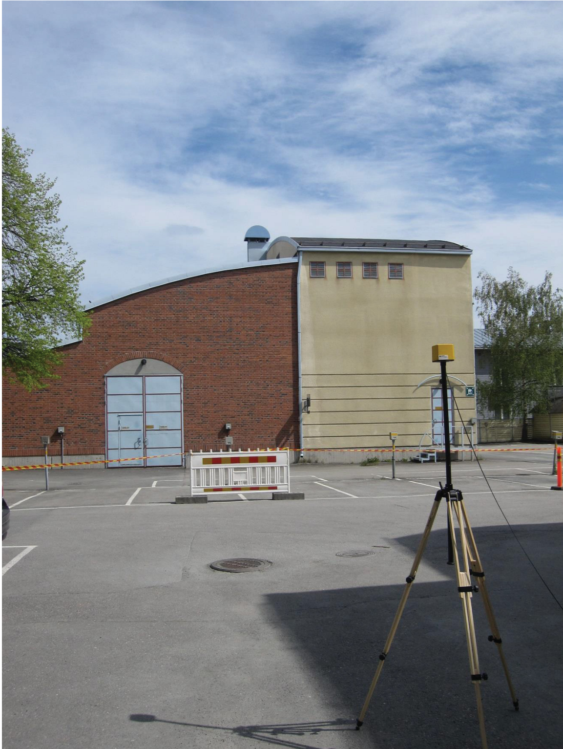
Kuva 4.13. Mittapiste F2, korkeus 2 metriä. Mittapisteen ympärillä oli runsaasti autoja parkissa, jotka eivät näy kuvassa. Mitatut tulokset mittapisteeltä ainoastaan suuntaa antavia.