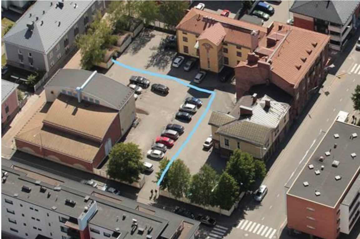
Kuva 4.3. Kuvan sinisen rajauksen ja muuntamon välinen alue oli mittausten aikana tyhjä autoista. Tässä kuvassa kyseisellä alueella on eniten autoja. Muuntamo on kuvassa vasemmassa alareunassa, ruskeakattoinen rakennus.

Mittausten aikana parkkipaikka oli tyhjennetty autoista. Kuvassa 4.3 on havainnollistettu alue, joka oli tyhjänä autoista mittausten aikana.