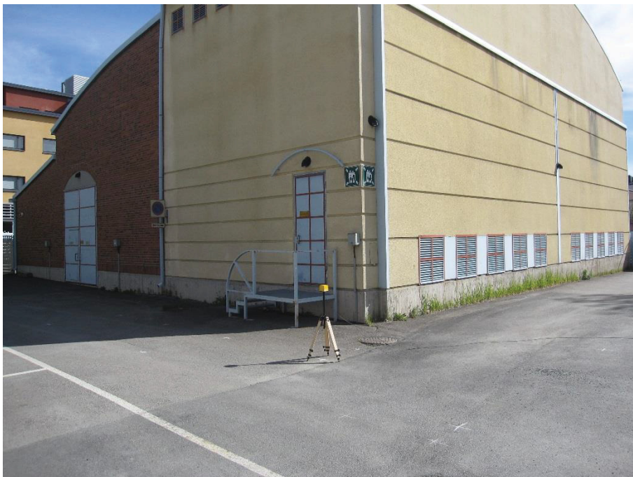
Kuva 4.6. Mittapiste A11, korkeus 1 metri. Muuntamon lounaiskulmalla metalliset portaat jotka vaikuttavat mittausepävarmuuteen.