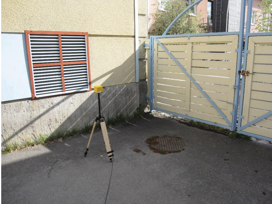
Kuva 4.5. Mittapiste A1, korkeus 1 metri. Ympärillä paljon mittausepävarmuuteen vaikuttavia metallisia, kiinteitä objekteja.