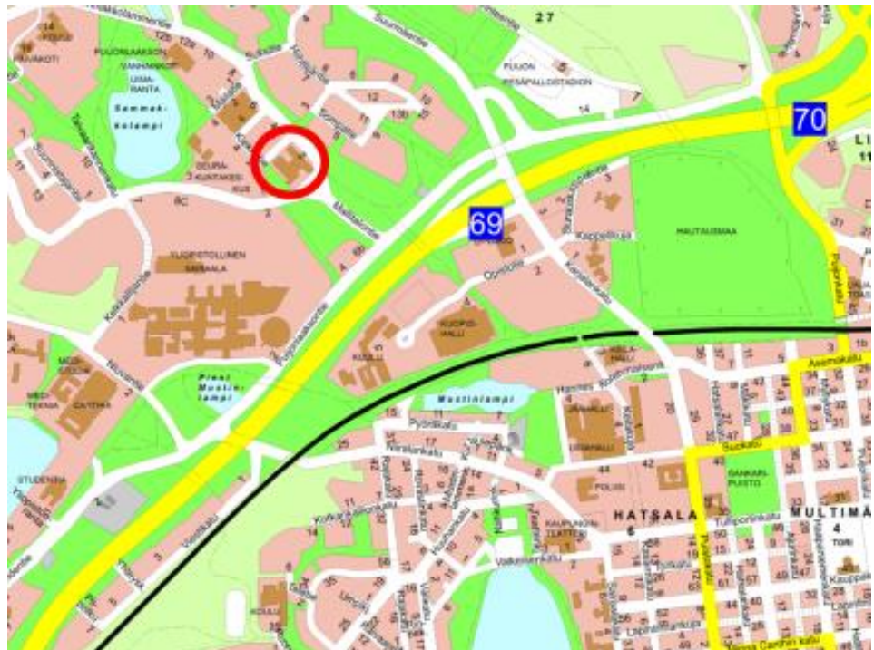
Kiinteistön sijainti opaskartalla.

Kuopion kaupunki on tutkinut vaihtoehtoja Hatsalan koulun sijainniksi. Selvityksissä kiinteistö on osoittautunut kouluverkoston kannalta hyväksi vaihtoehdoksi. Savon koulutuskuntayhtymän edustajien kanssa on käyty neuvotteluja kiinteistön ostamisesta kaupungille. Kiinteistön sijainti on osoitettu oheisissa kartoissa.