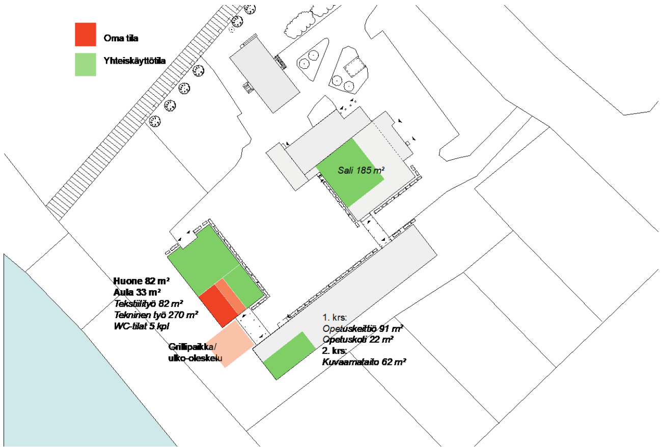
Kuva 4. Yhtenäiskoulun yhteiskäyttöön sopivia tiloja.