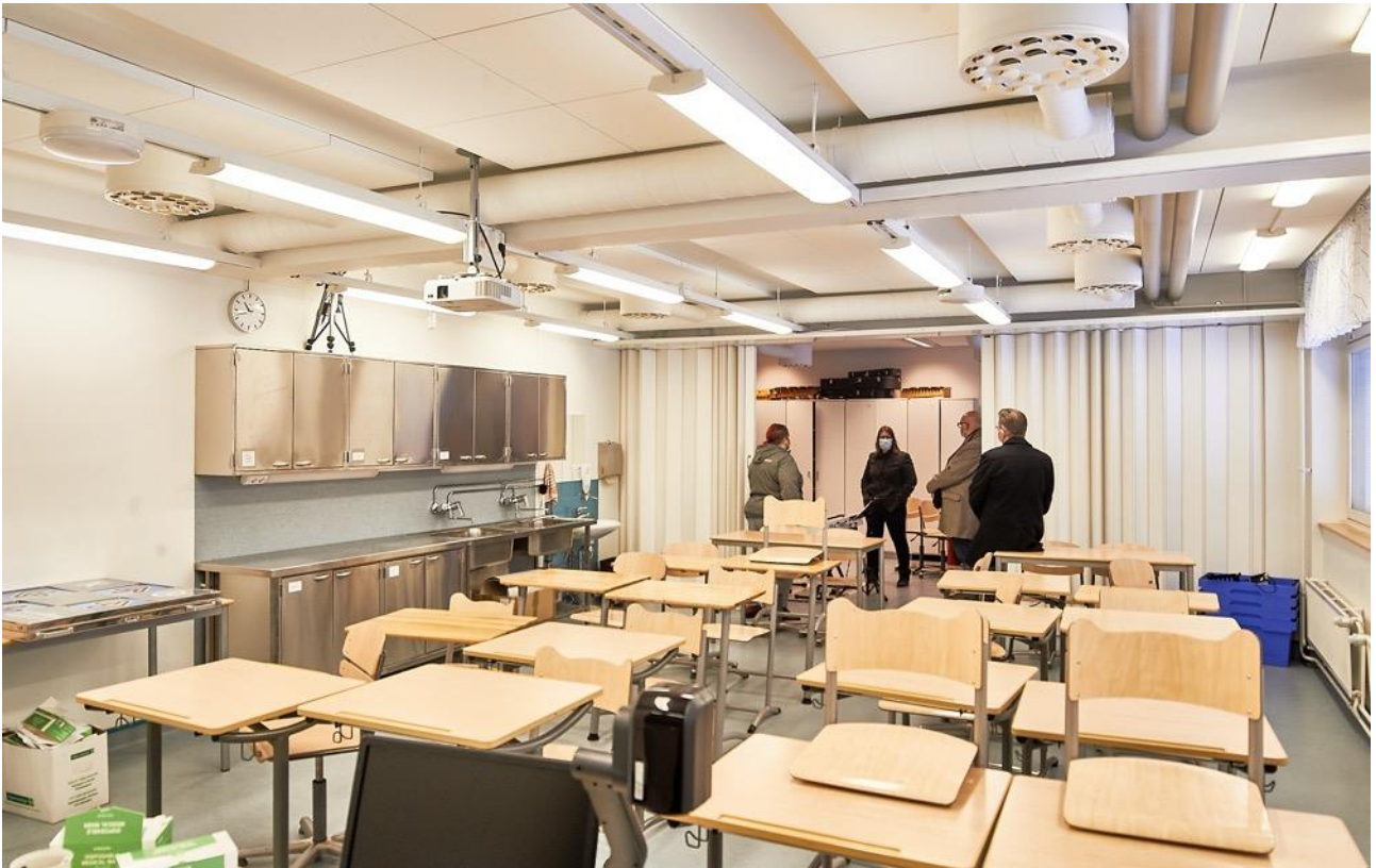
Kuva 6. Nykyinen musiikkiluokka, joka muutetaan väistötilaksi.