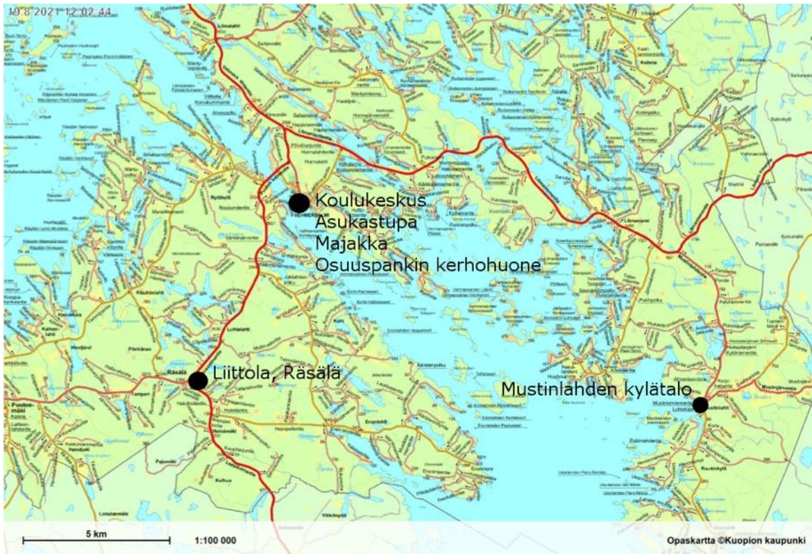
Kuva 1. Kasvun ja oppimisen palvelualueen sekä hyvinvoinnin edistämisen palvelualueen toimipisteitä.