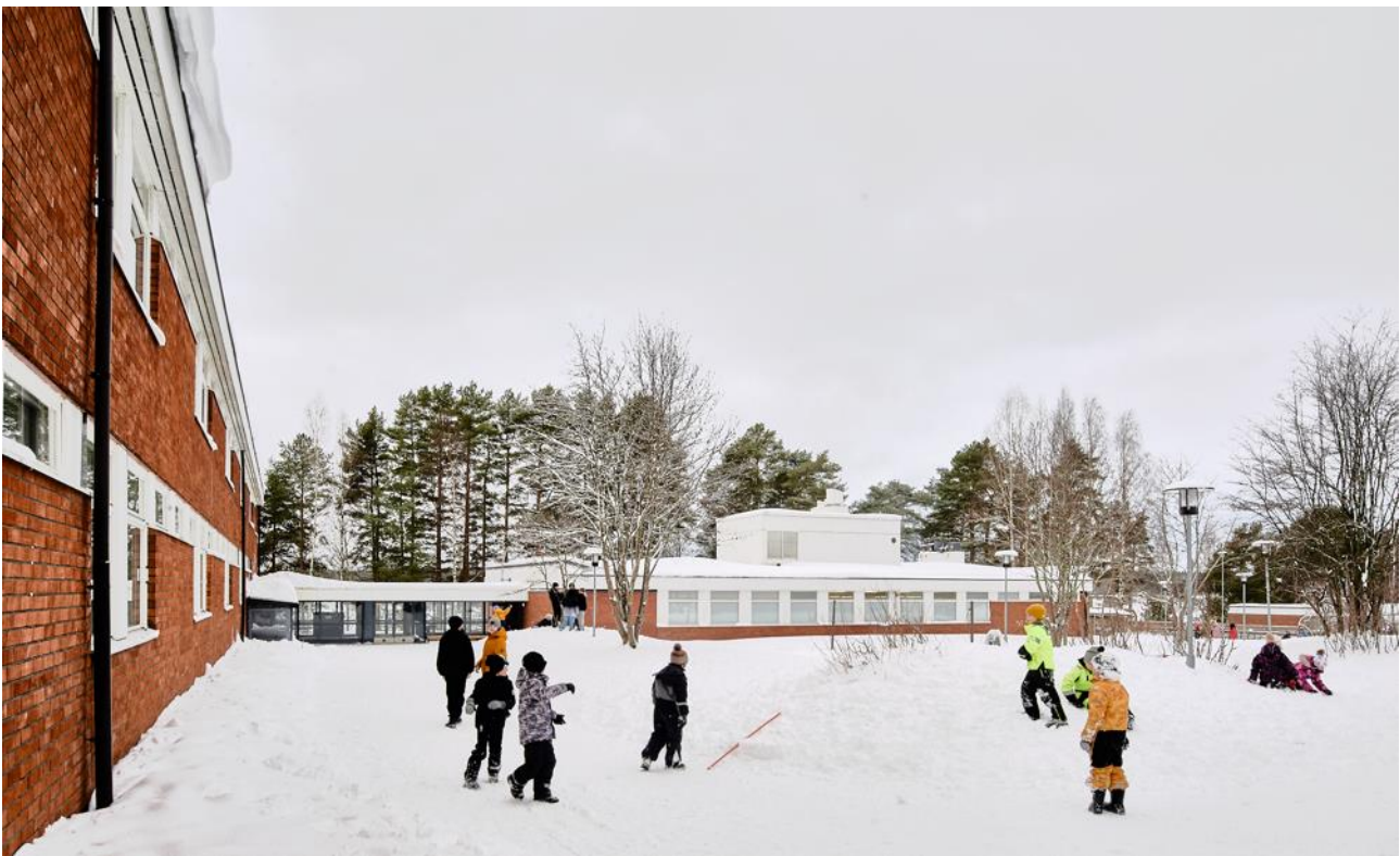
Kuva 2. Yhtenäiskoulun rakennus C. Vasemmalla A-rakennus, jossa opetus pääosin tapahtuu.

Hankesuunnitteluryhmä esittää nuorisopalveluiden väliaikaista siirtoa yhtenäiskoulun C-rakennuksen tiloihin osoitteessa Vehmersalmenkatu 27. Soveltuvat tilat ovat nykyinen musiikkiluokka ja siihen liittyvä aula wc-tiloineen.