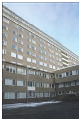
Sairaalan eteläisivua sisäpihalta kuvattuna.

id: 300648 rakennustunnus: 101634583X rakennustyyppi: laitosrakennukset alkup. käyttö: 211 keskussairaalat