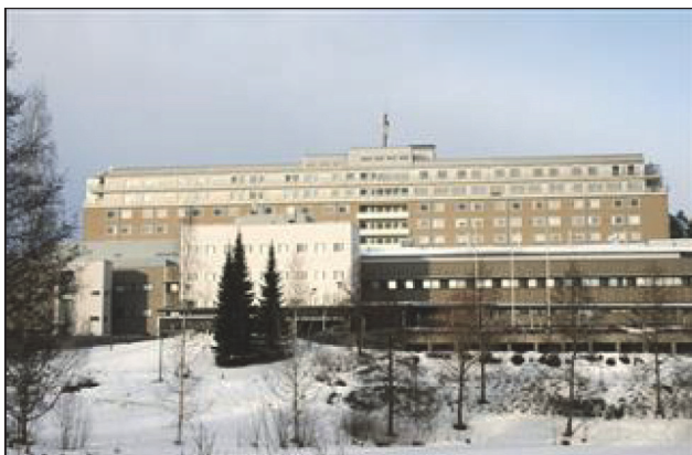
Sairaalan eteläisivu kohoaa uudempien osien takana.