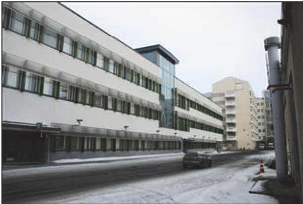
Sädesairaalan eteläsivua.

id: 300665 rakennustunnus: 103530326X rakennustyyppi: laitosrakennukset alkup. käyttö: 211 keskussairaalat nyk. käyttö: 211 keskussairaalat ajoitus: 2015 kerrosluku: 3 perustus: betoni runko: betoni? vuoraus: rappaus?