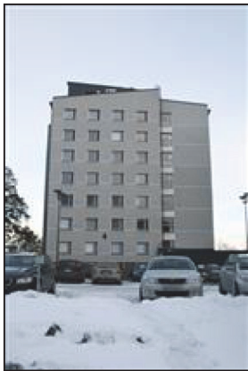
Rakennuksen luoteissivu.