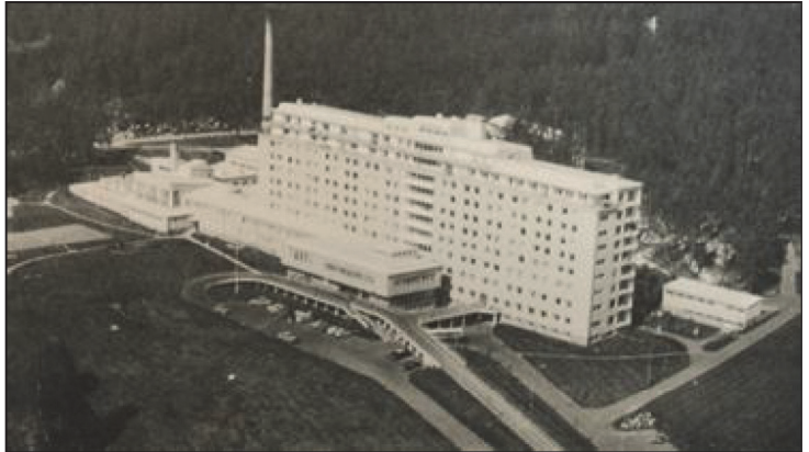
Postikorttikuva vuodelta 1960.