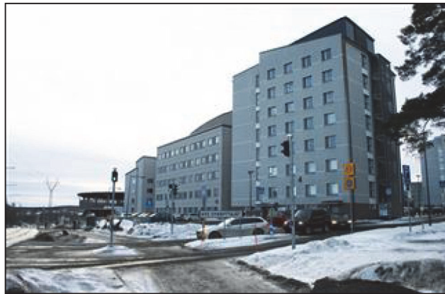
Rakennus etummaisena, taaempänä uudisosa, entinen ailiääkärien asuinkerrostalo ja pyöreä pysäköintilaitos. Kaakkoissivua Puijonlaaksontien varrella.