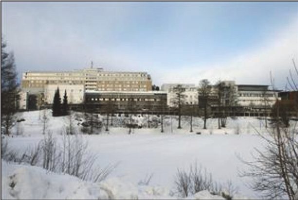
KYSin eteläiset pääjulkisivut.