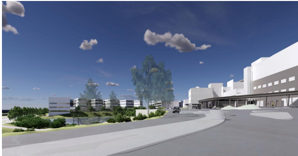
Kuva 4 Näkymä Eteläväylältä pääsisäänkäynnin A suuntaan, suuntaa antava kuva. Raami Arkkitehdit Oy, Arkkitehdit Kontukoski Oy.

Autot sijoitetaan pääosin pysäköintilaitoksiin. Tonttia varten vaadittavia autopaikkoja saa sijoittaa myös lähialueen LPY-korttelialueille tai muille pysäköintiin varattaville alueille.