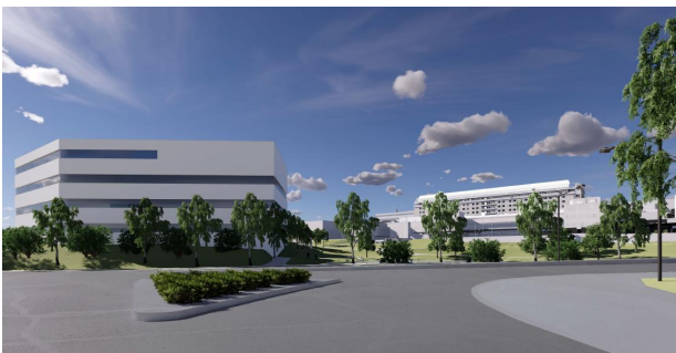
Kuva 3 Näkymä Niiralankadulta, suuntaa antava kuva. Raami Arkkitehdit Oy, Arkkitehdit Kontukoski Oy

Kelkkailijantien varrelle tulee toteuttaa liito-oravan liikkuksen kannalta riittävä puusto, joko katualueelle tai Puijon sairaalan tontille. Jos puustoa joudutaan rakennustöiden takia kaatamaan, tulee se korvata siten, että liito-oravan liikkuminen turvataan. Kelkkailijantien maanalaisen infraverkoston ja tulevan sairaalarakentamisen takia on mahdollista, että puustoa joudutaan kaatamaan tai se saattaa vaurioitua töiden seurauksena. Tämän vuoksi puusto tulee kartoittaa ja huomioida alueen tarkemmassa suunnittelussa. Liito-oravalle tärkeä puusto tulee säilyttää tontin pohjoisosassa (pl-28).