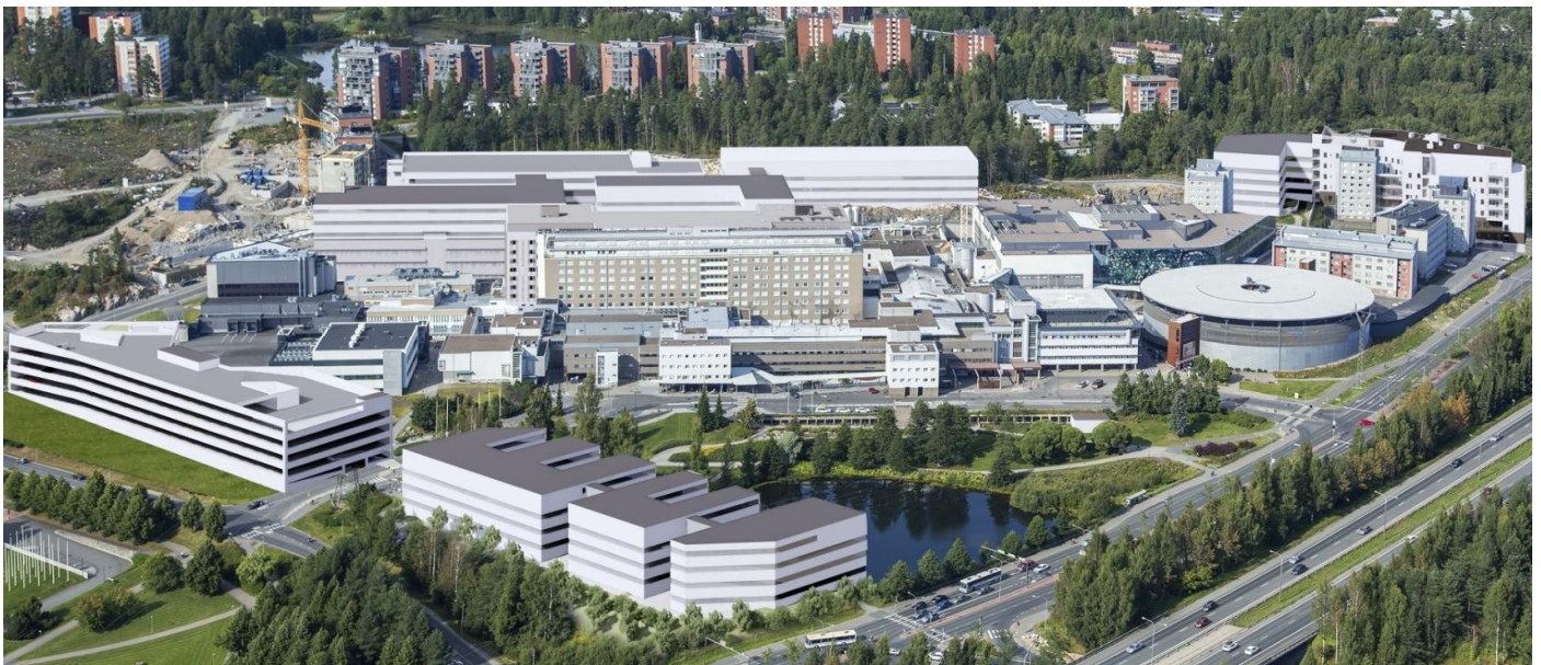
Kuva 1 Näkymä etelästä, suuntaa antava kuva, Raami Arkkitehdit Oy, Arkkitehdit Kontukoski Oy